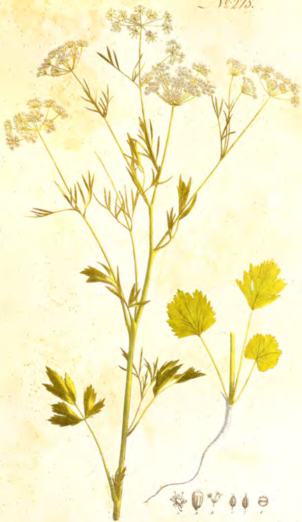
Pinipenella Anisum L.