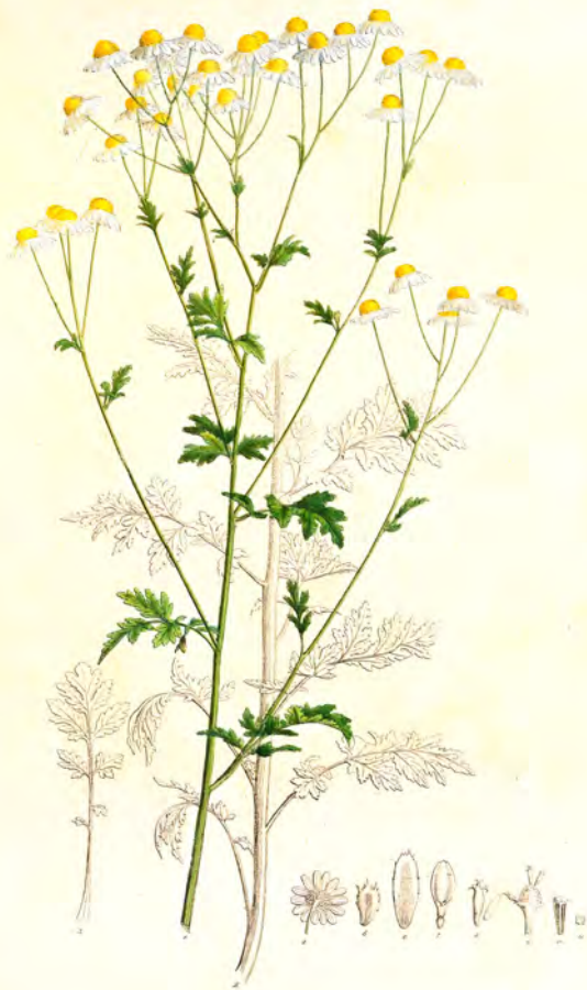
Pyrethrum botanicum Linn.