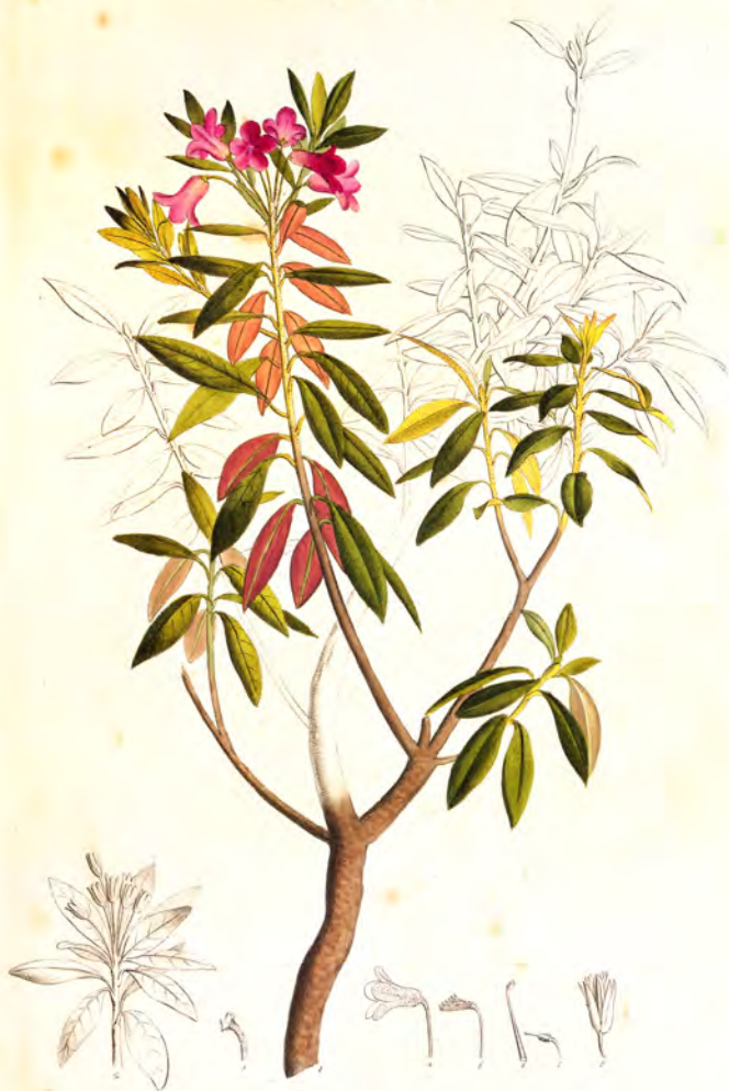
Rhododendron ferrugineum L.