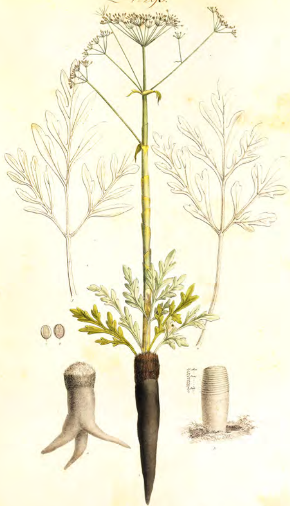
Ferula asa foetida Lin