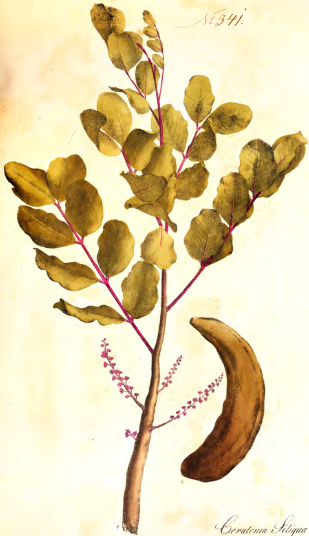
Ceratonia Siliqua L. f. var.