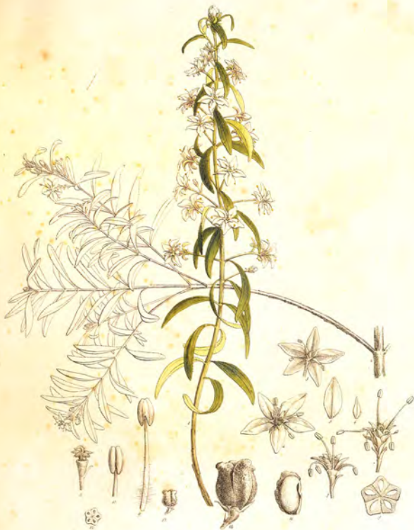
Diosma serratifolia Vahl