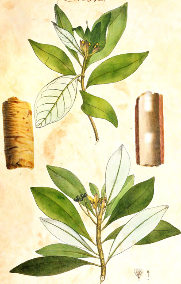
Wintera aromatica L.