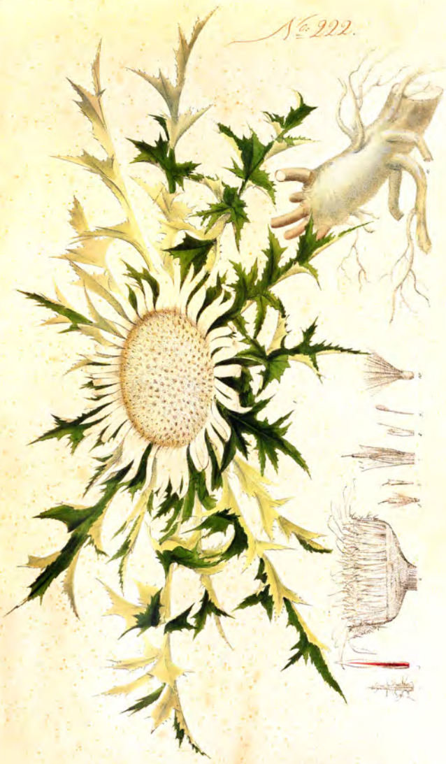
Carlina occulta L.