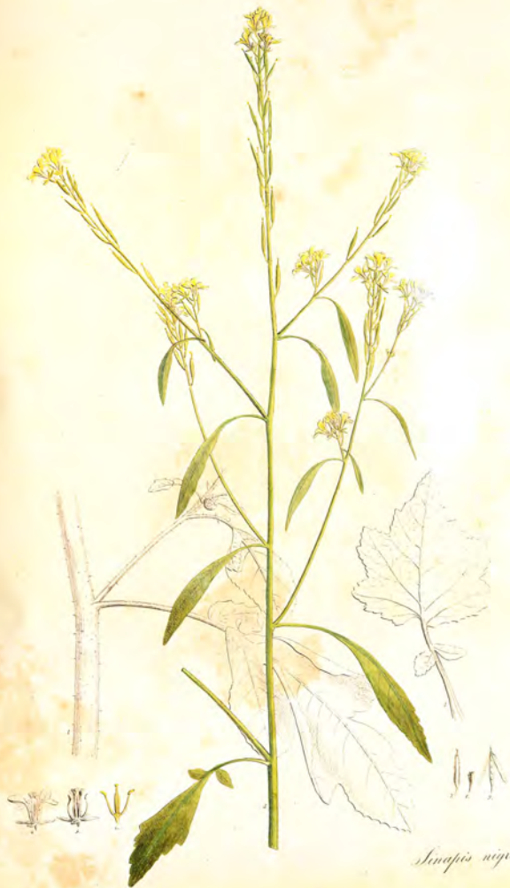
Sinapis nigra Linn.