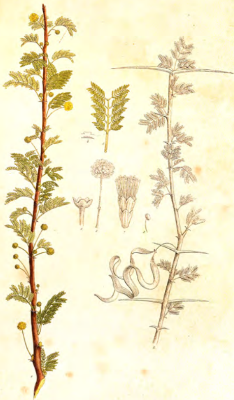
Acacia tortilis Torr.