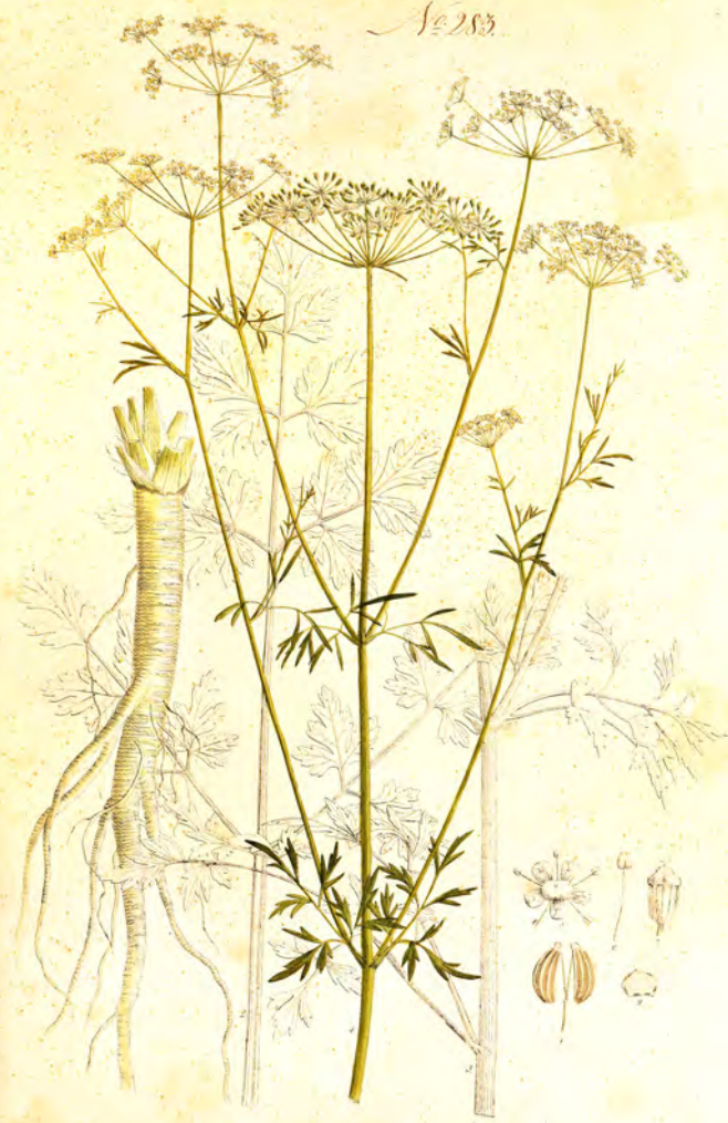
Paoselinum sativum L.