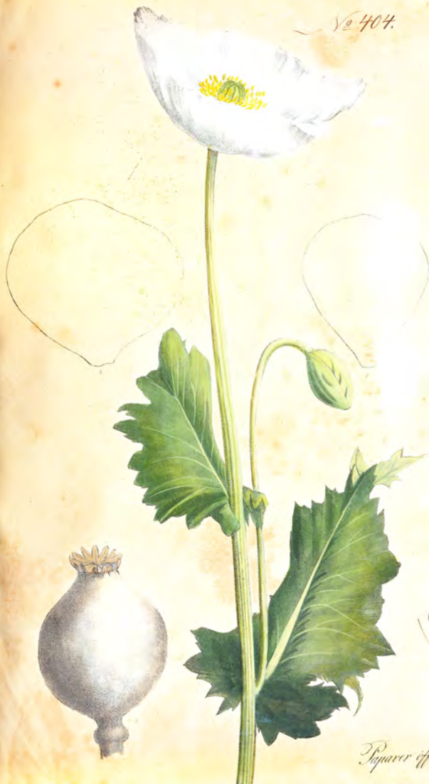
Papaver officinale Gm.