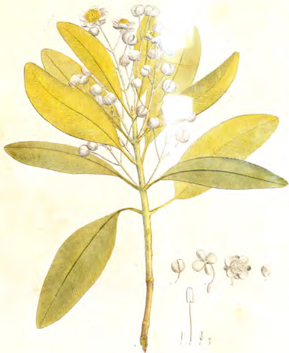
Calophyllum Tacamahaca Willd.