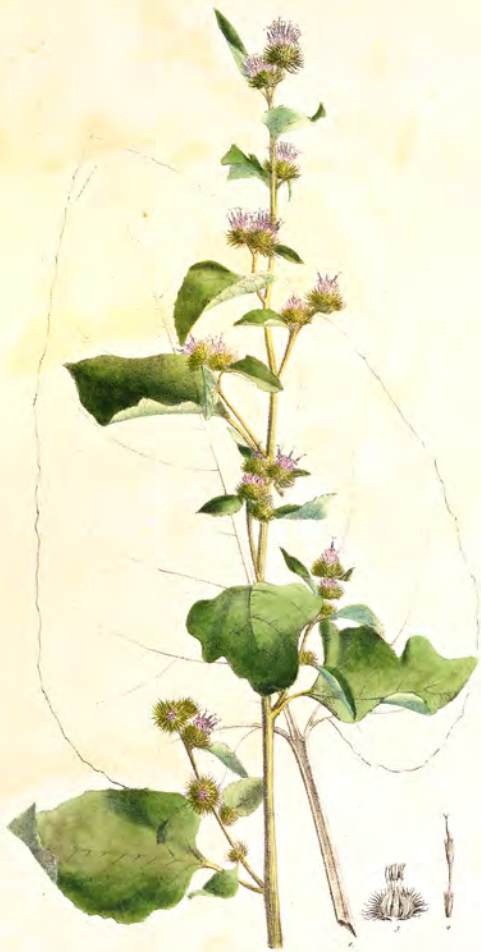
Arctium minus Lch.