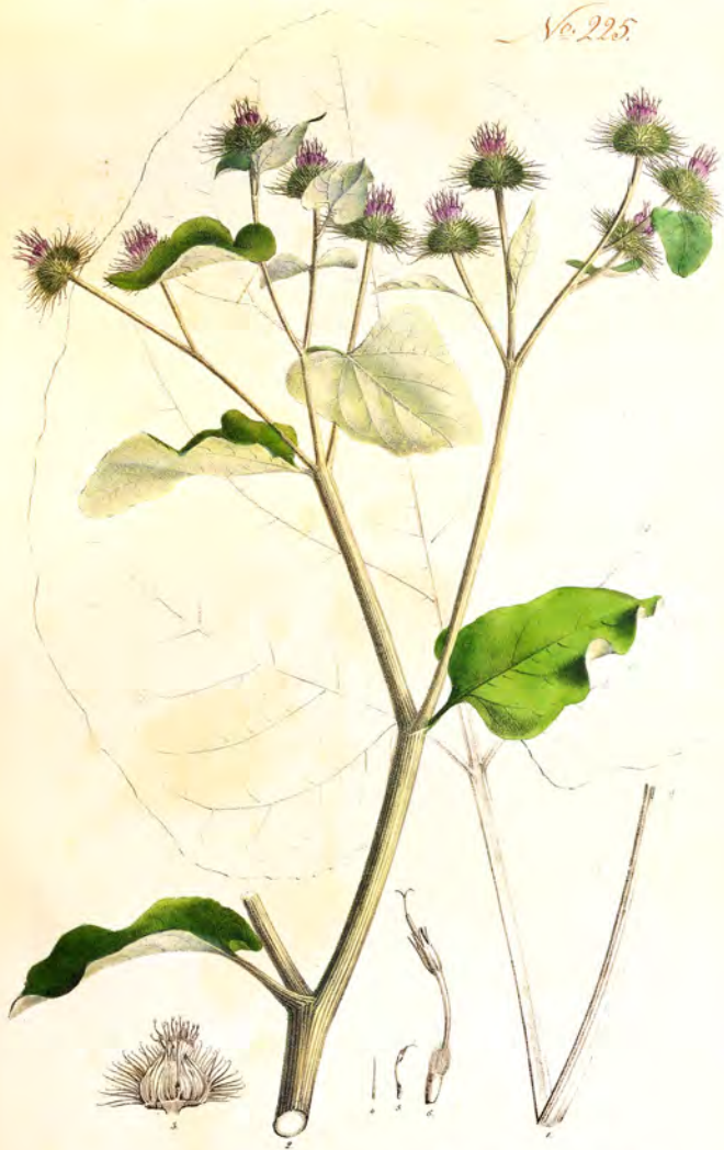
Atractium majus Schk.