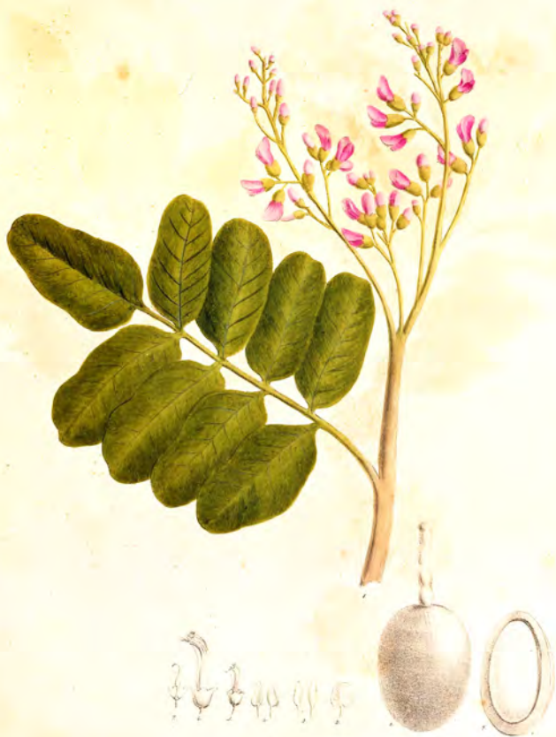
Geoffrea surinamensis Benth.