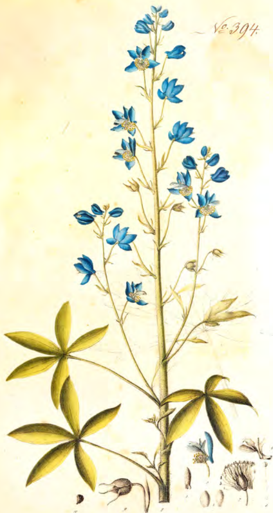
Delphinium ajacis L.