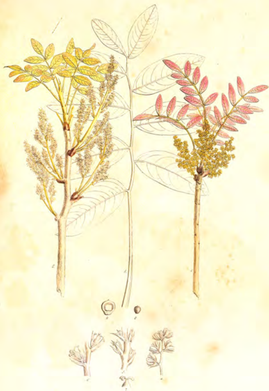
Pistacia Terbinthus L.