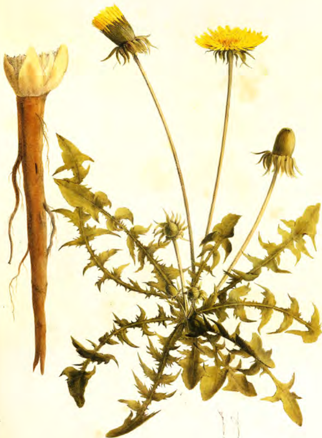
11 Leontodon taraxacum