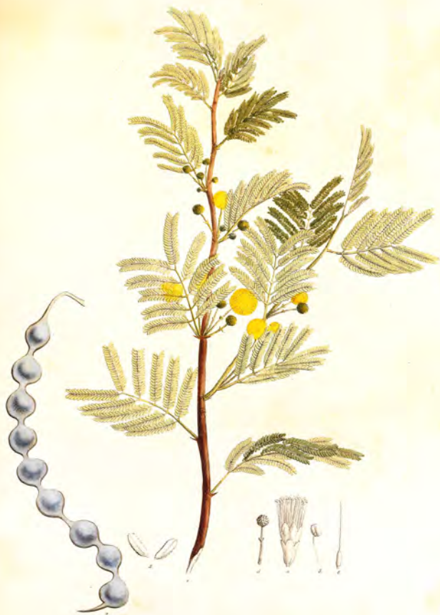
Acacia arabica Rost