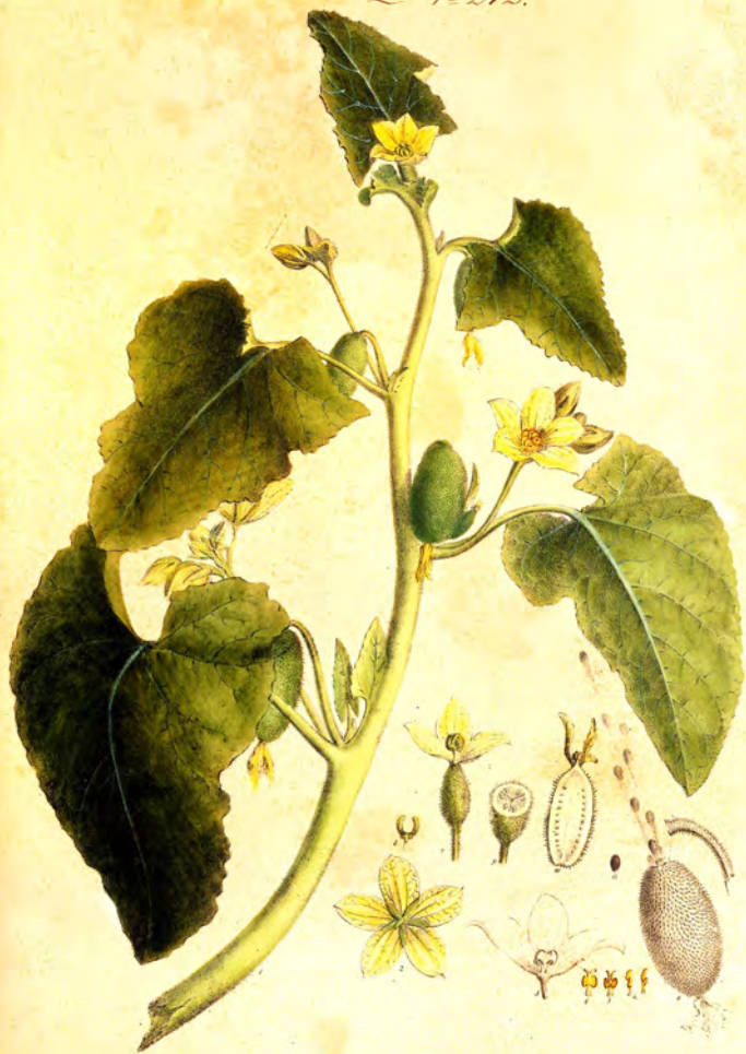
Momordica Elaterium Lin.