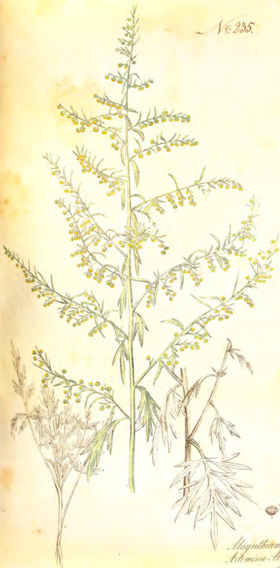
Asyntherium officinale St. Asteriscia Asyntherium Linn