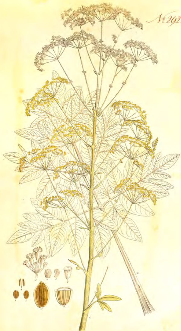
Chironium Chironium Koch