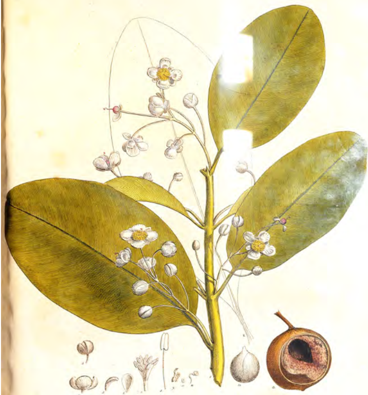
Calophyllum Inophyllum L.