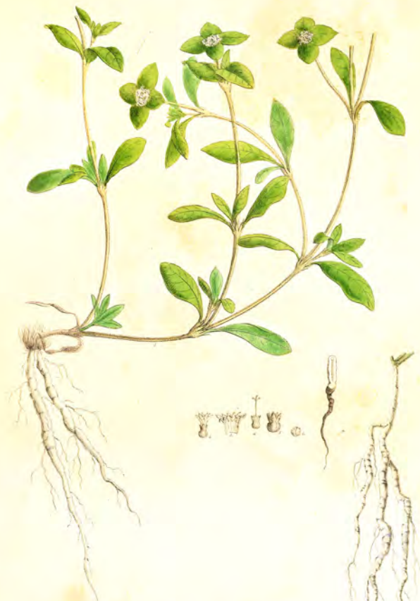
Rubricoccus scabra Ait.