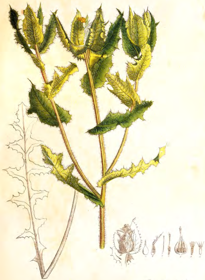
Cnicus benedictus L. Centauria benedicta L.