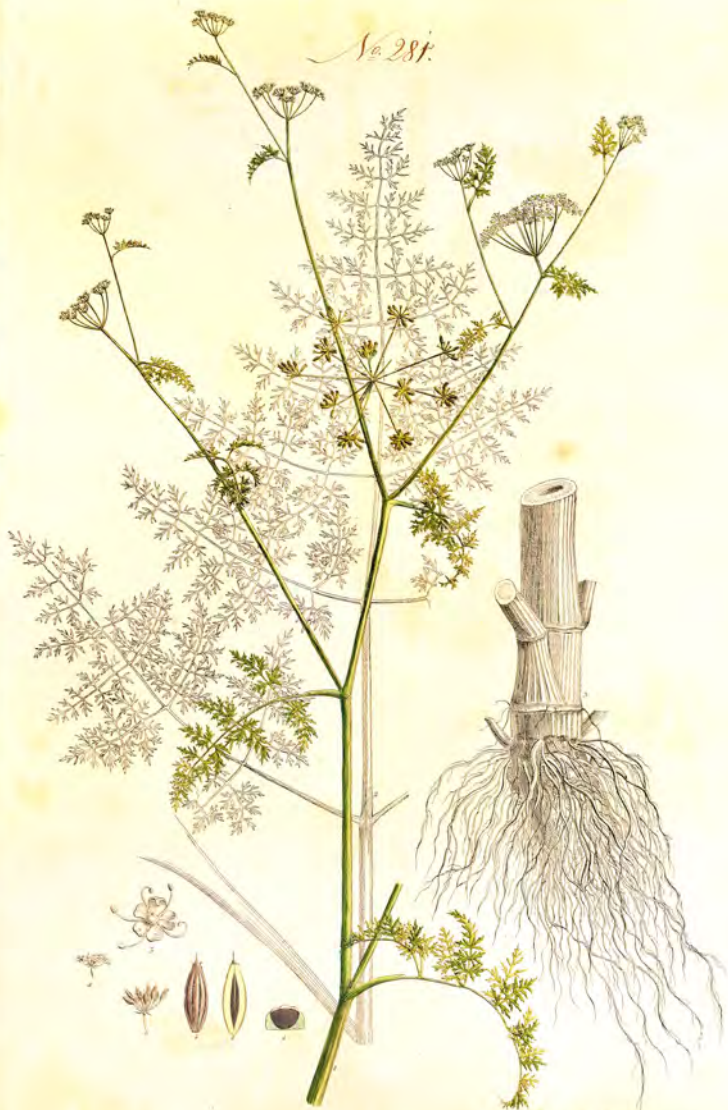
Cuminum maculatum L.