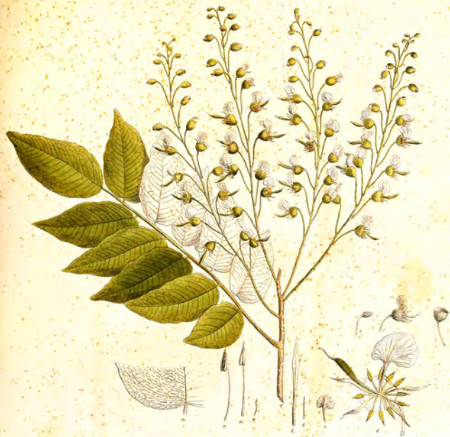
Myracrodon peruvicum L.