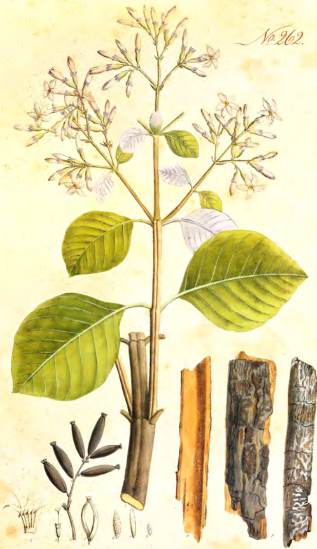
Cinchona crata — cordifolia var. Hb.