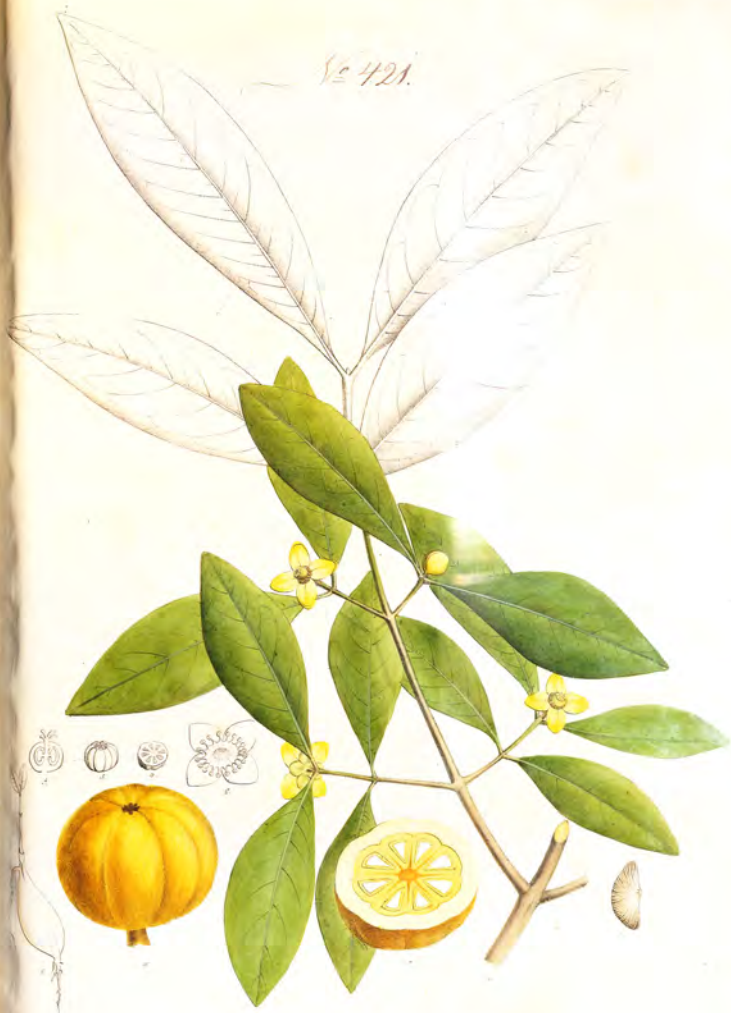
Garcinia Cambogia Willd.