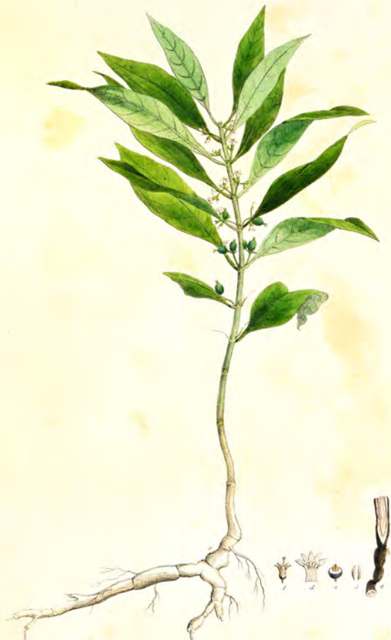
Psychotria emetica Willd.