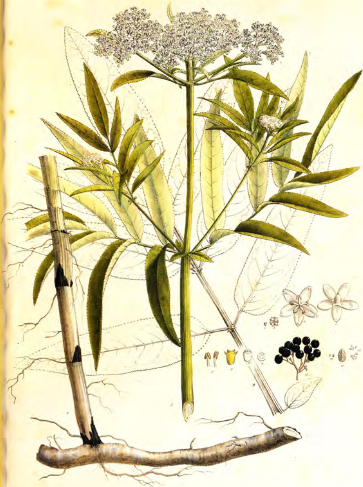
Sambucus Ebulus Lin