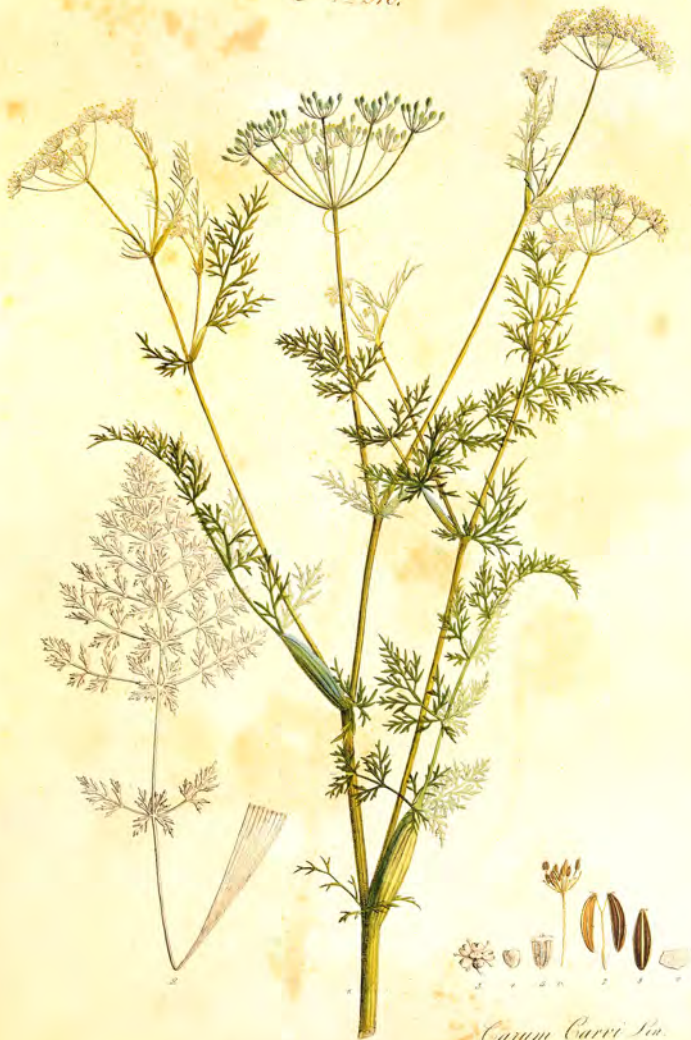
Carum Carvi L.