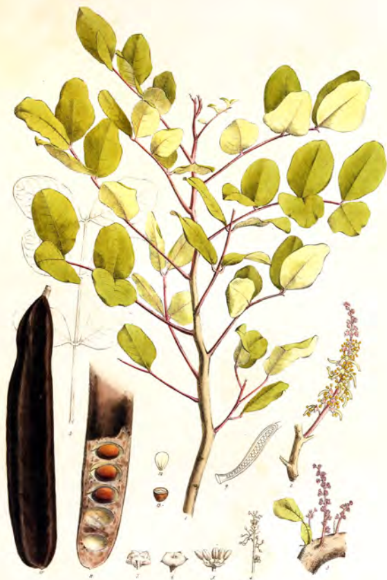
Ceratonia siliqua L. carob tree