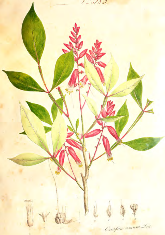
Cuapia amara Lin.