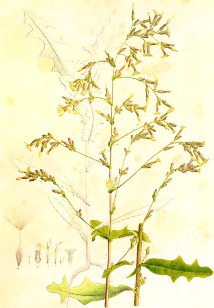
Lactuca scariola L.