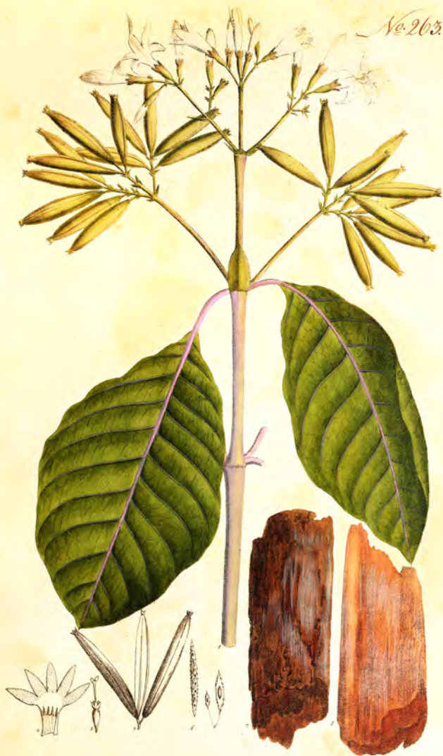
Cinchona elongifolia H.