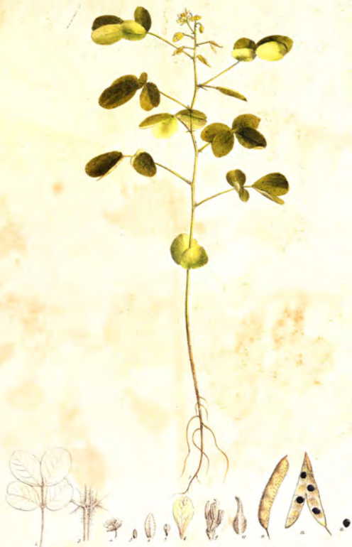
Cassia Absus Lin.