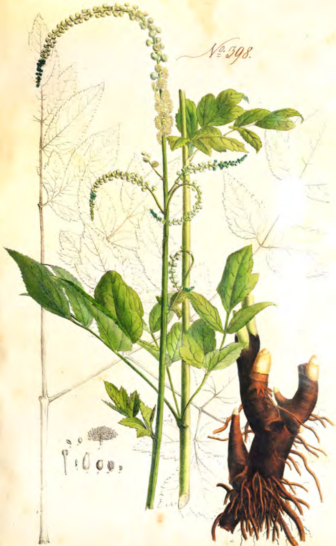
Actaea racemosa L.