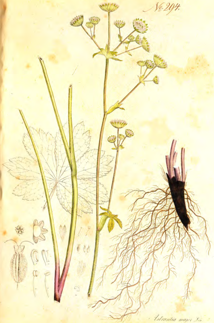
Islandia major L.