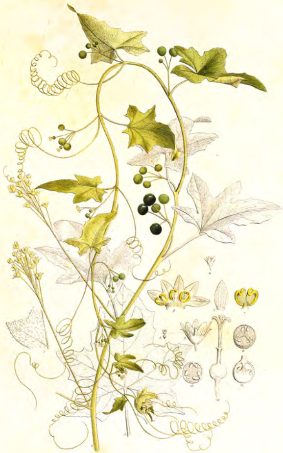
Bryonia alba L.