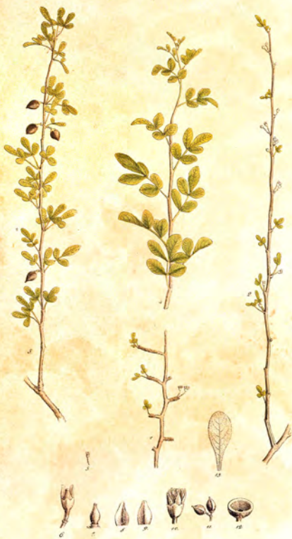
Balsamedendron Itadense Kuntz.