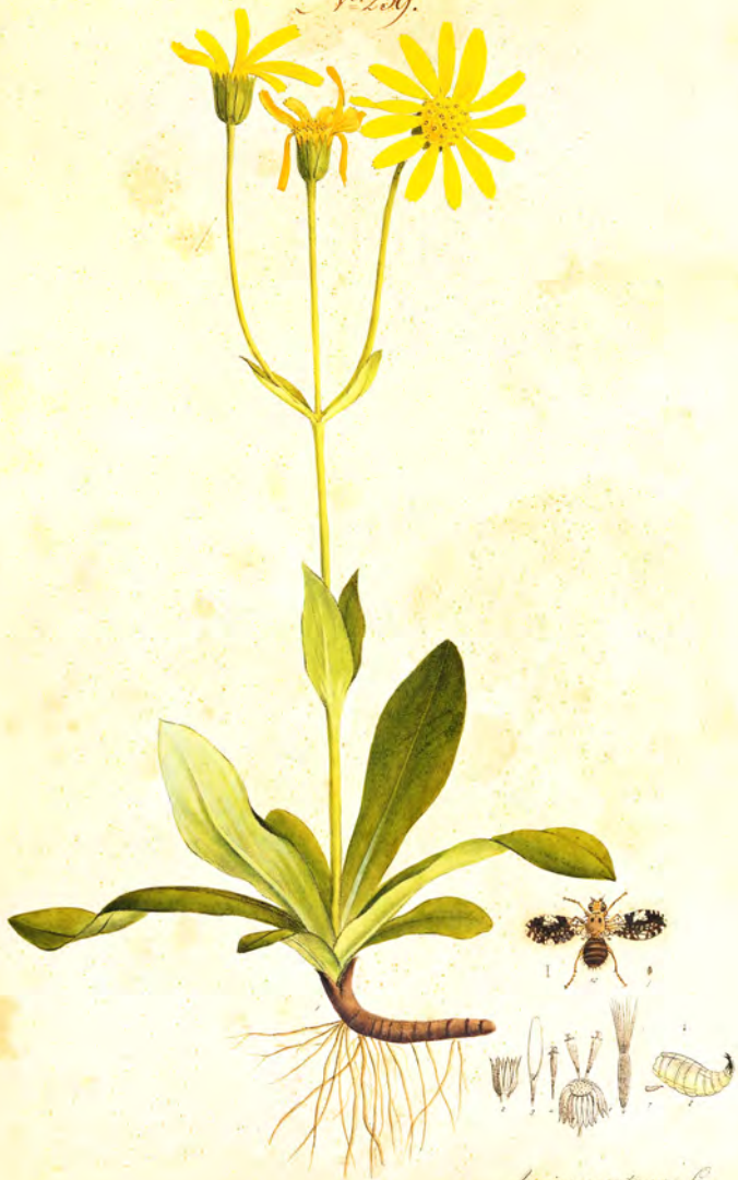
Arnica montana L.