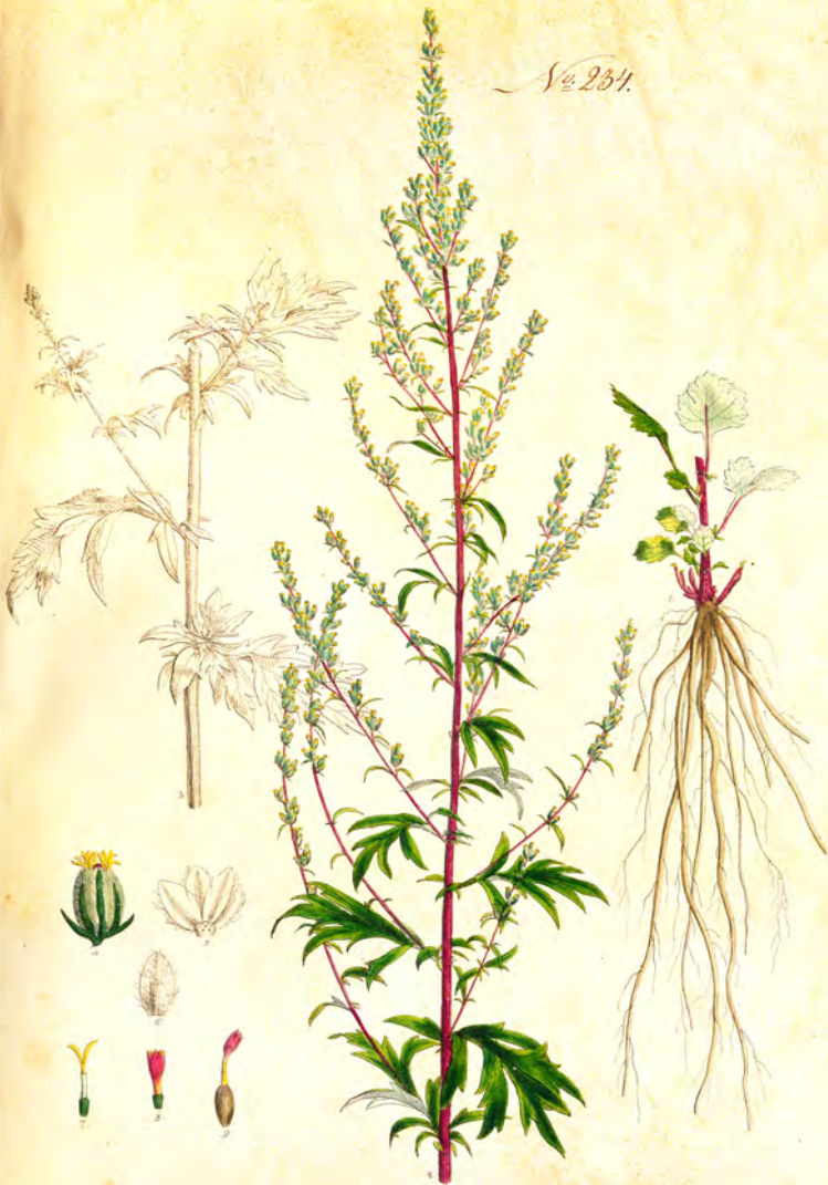
Artemisia vulgaris L.