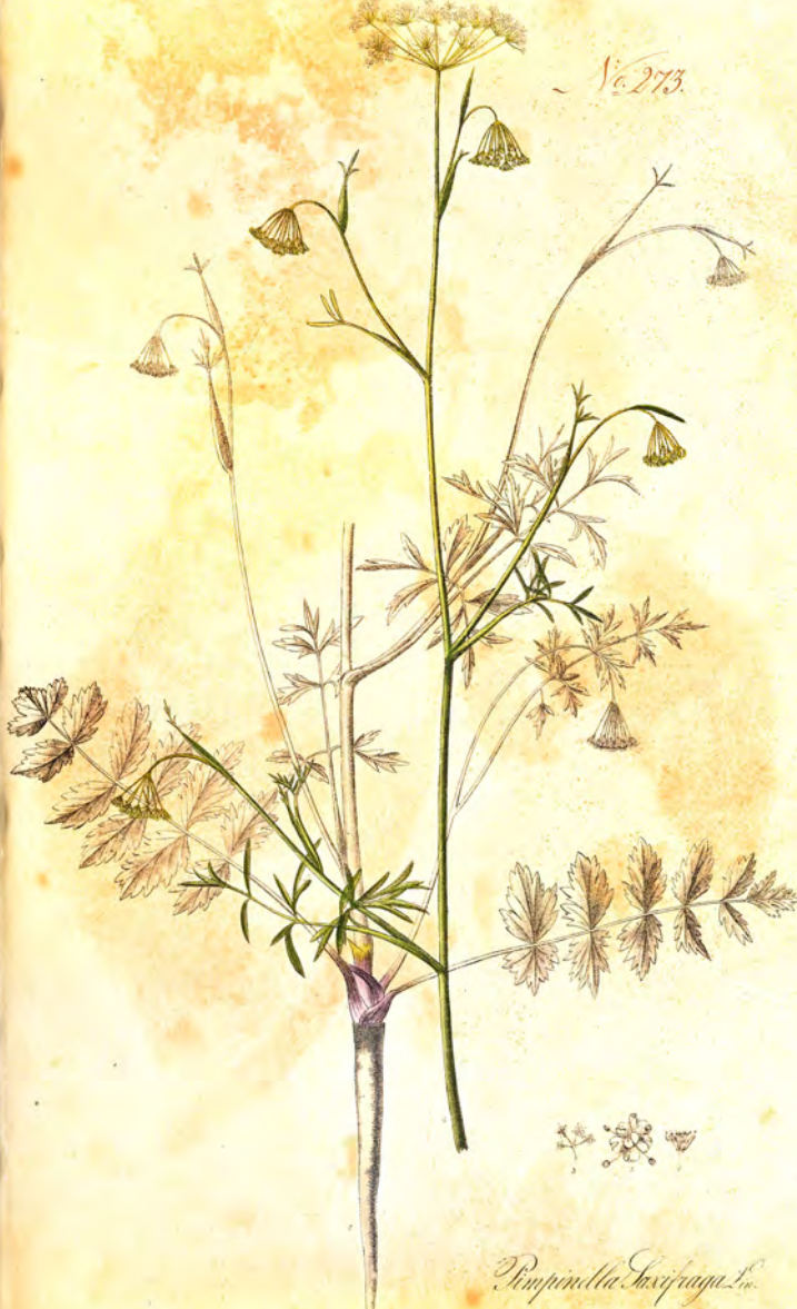
Pimpinella Saxifraga L.