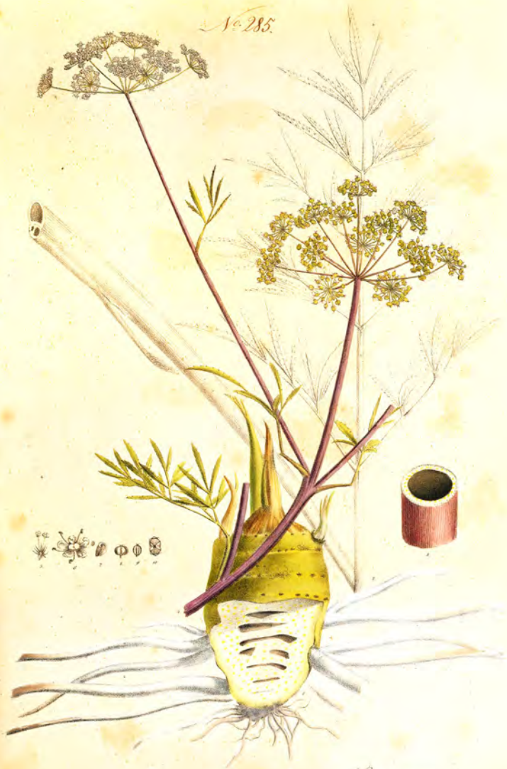
Cauda visca Lin.