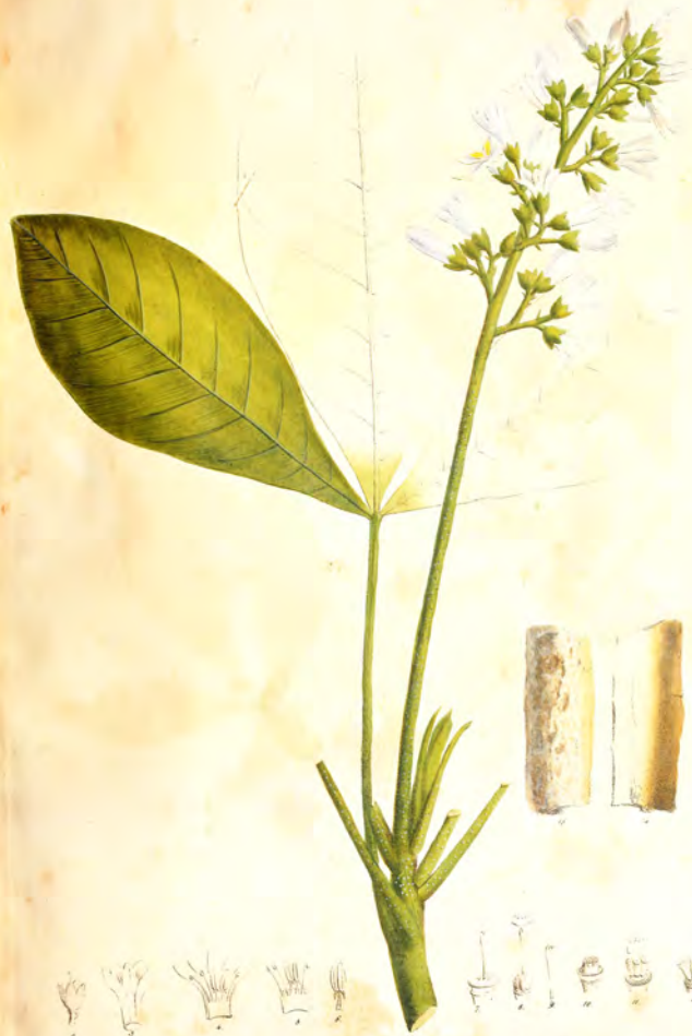
Bonplandia trifolata Willd.