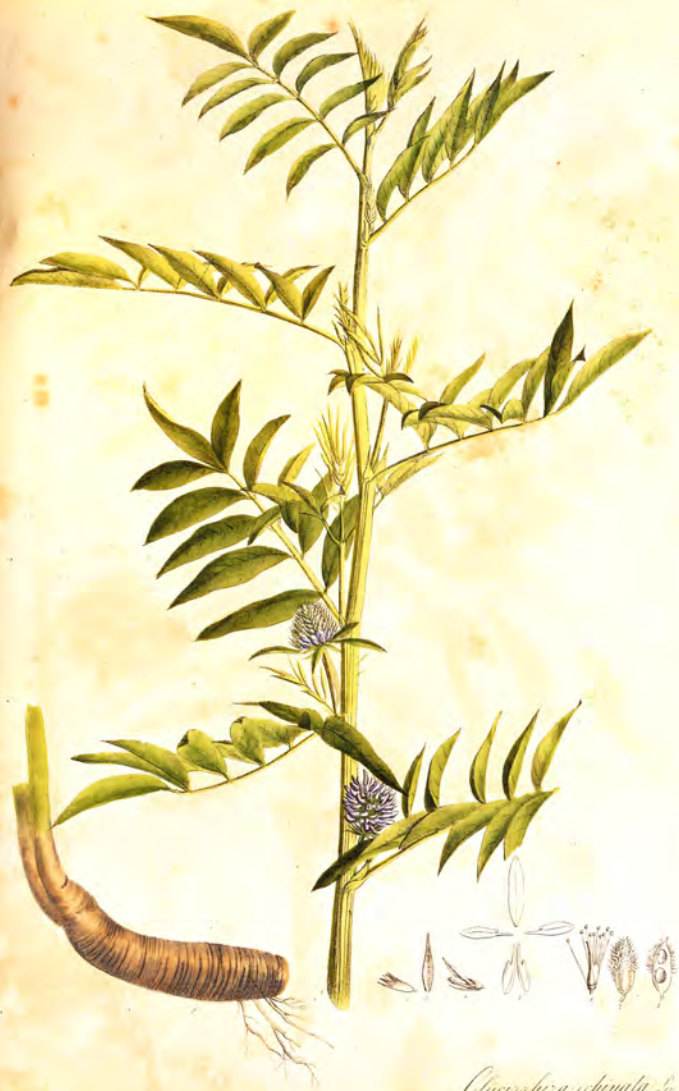
Glycyrrhiza chinensis L.