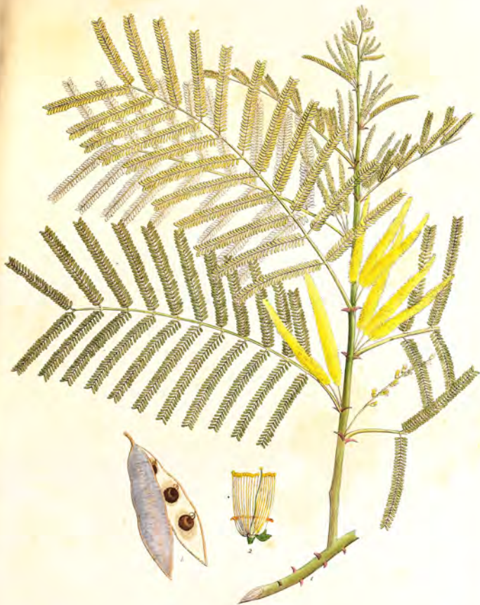
Acacia Catanua Willd.