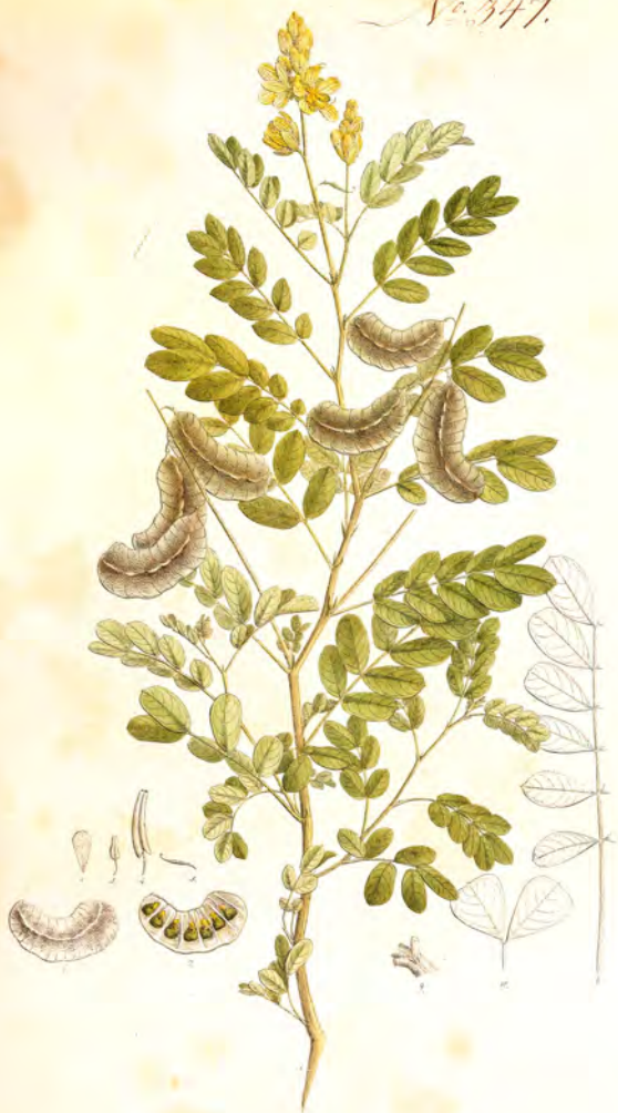
Cassia obovata Hayne