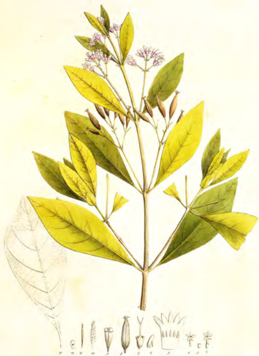
Cinchona lanceifolia Mutis