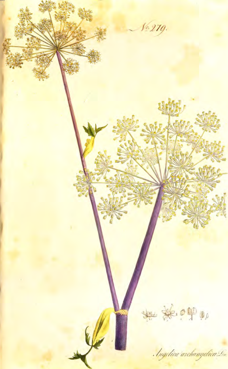
Angelica archangelica Linn.