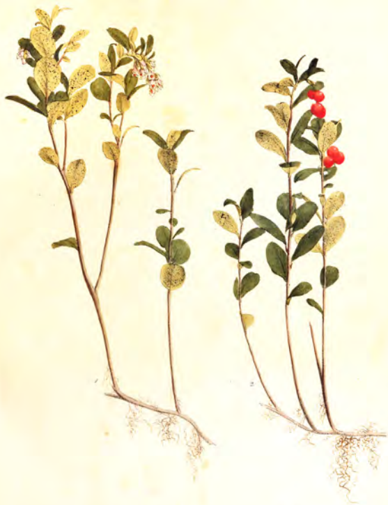
Vaccinium vitis-idaea L.