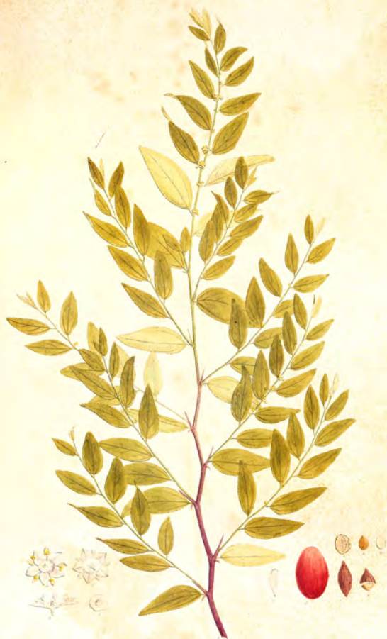
Zizyphus vulgaris Lam.