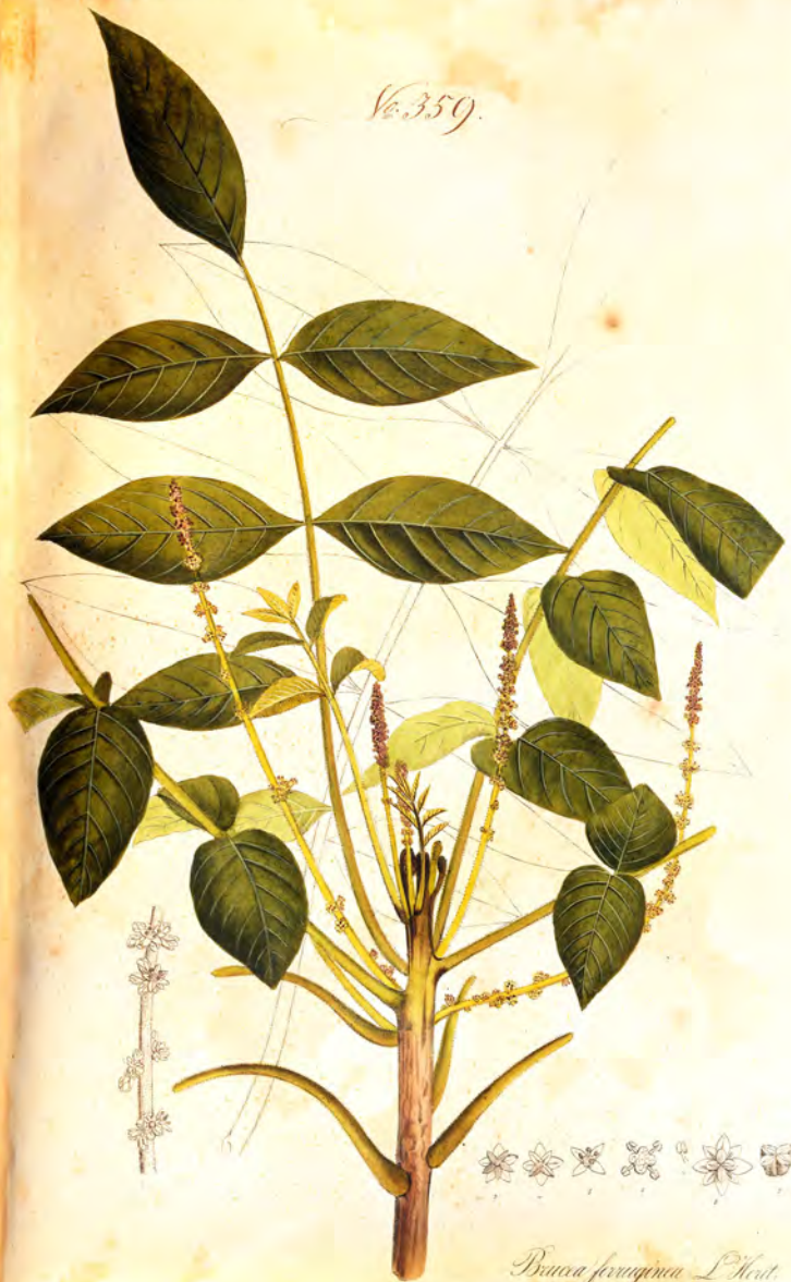
Brassica fruticulosa L'Herit.