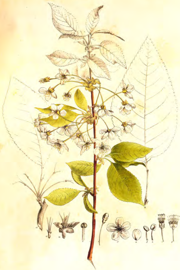
Cerasus dulcis Borkh