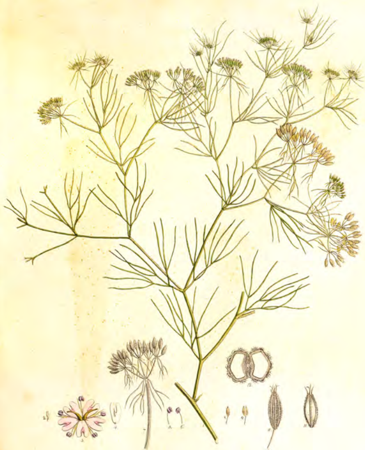
Cuminum Cyminum Linn.