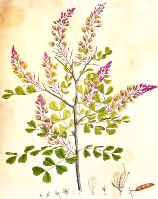
Haematoxylon campechianum Sw.