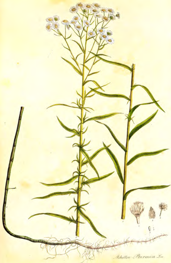
Achillea Ptarmica L.