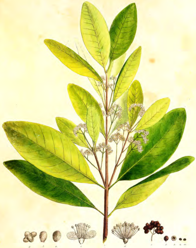
Myrtus Pimenta Linn.