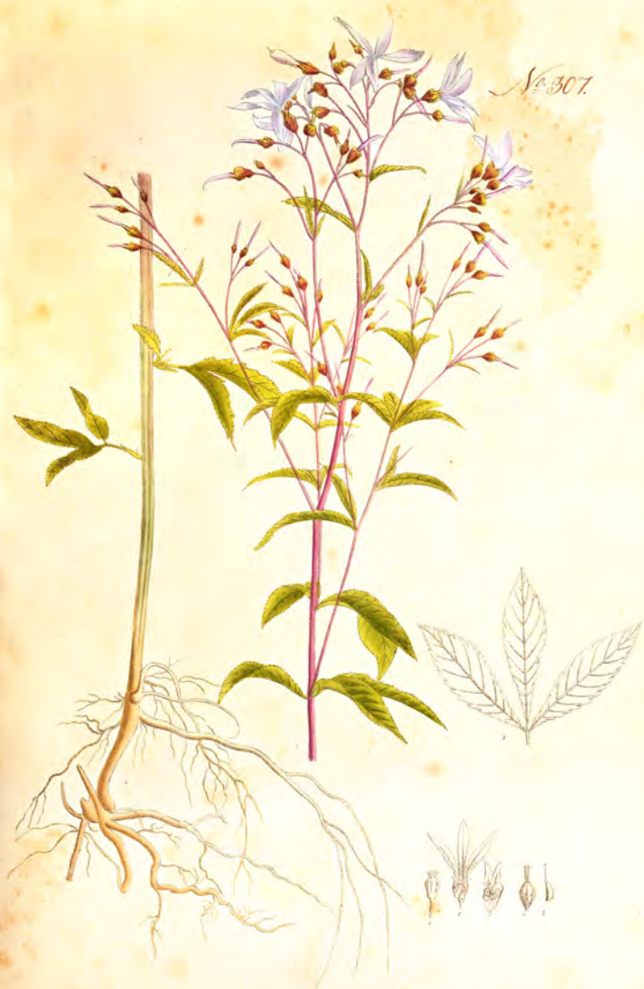
Spicaria trifoliata Lin.