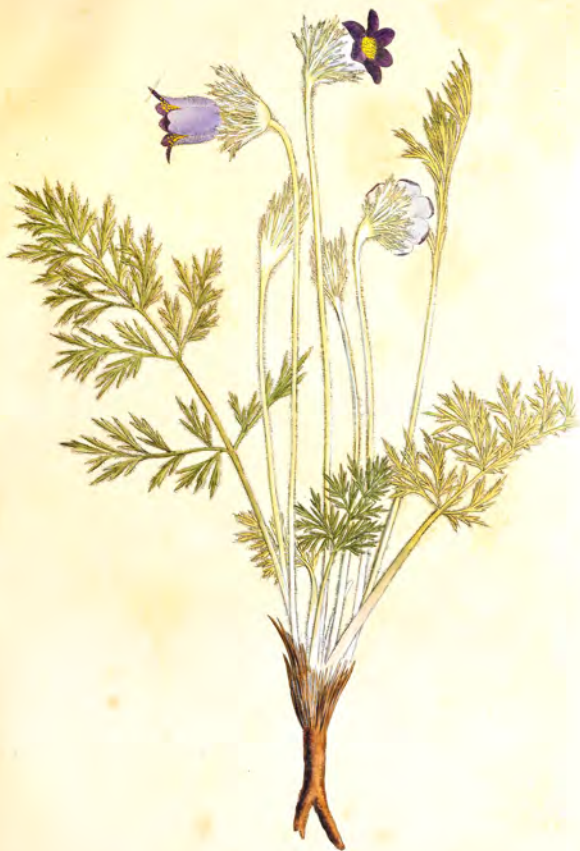
Anemone pratensis L.