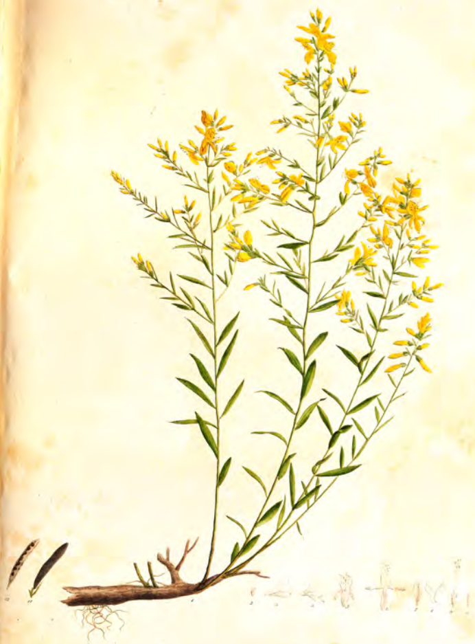
Genista tinctoria L.