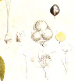
Thoa sticta Steyne. — Boha var. L.ii.