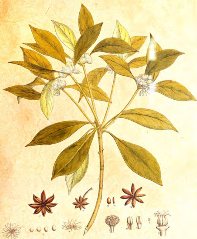
Allicium anisatum L.