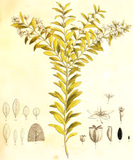
Piasma crenata L.