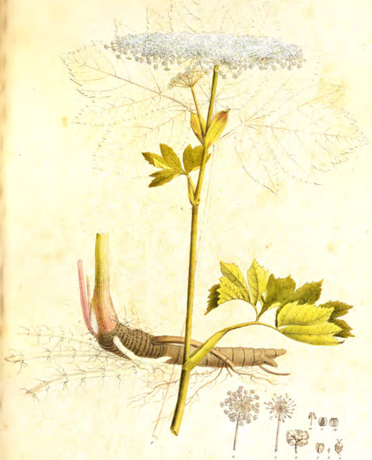
Pimpinella Saxifraga Koch. ( Saxifraga Cotinifolia Linn.)