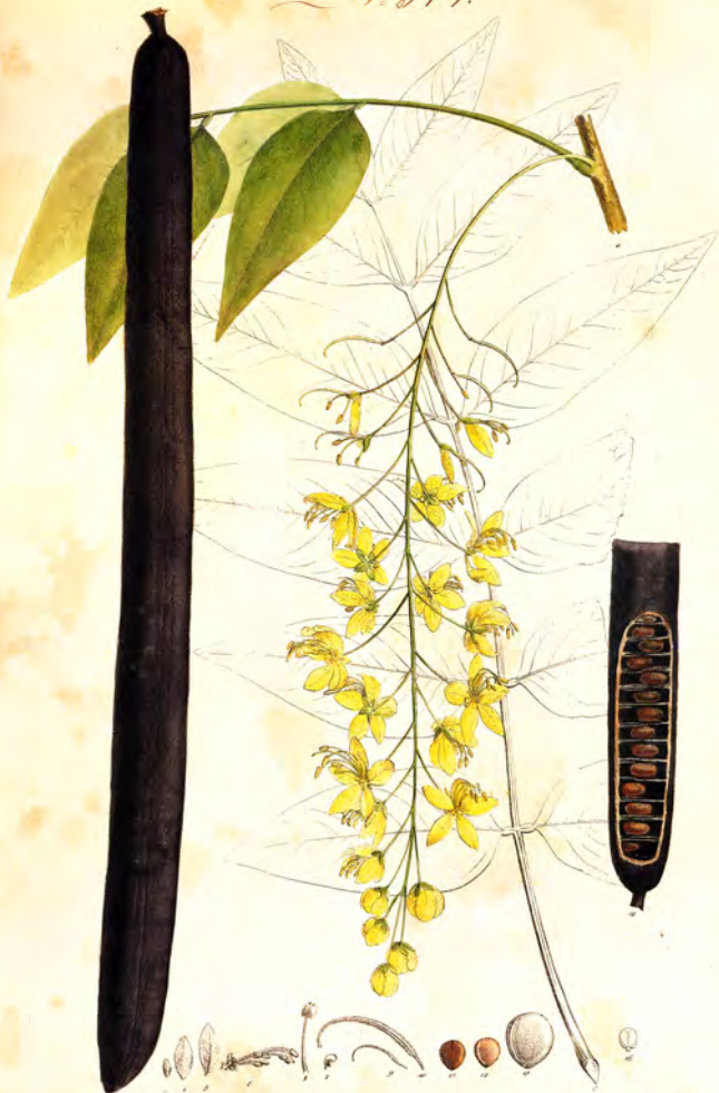
Cathartocarpus Fistula Pers ( Cuscuta Fistula Lin)