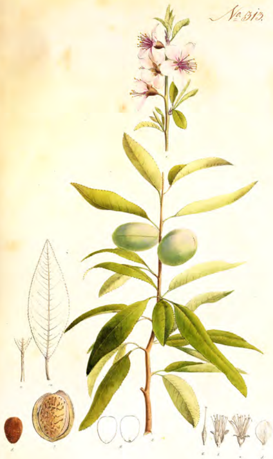
Amygdalus communis var. amara.