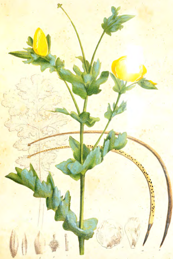
Glaucium flavum L.