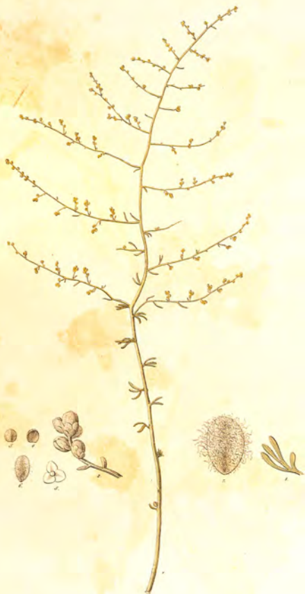
Artemisia glomerata L.