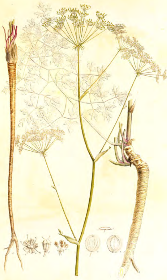
Swedanum Crasidium. H. K.