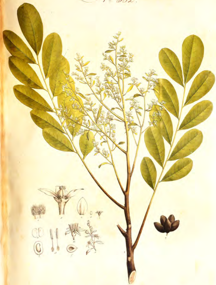
Simaruba amara Hayne